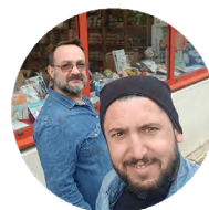
Enes Cerclades Cordonnerie